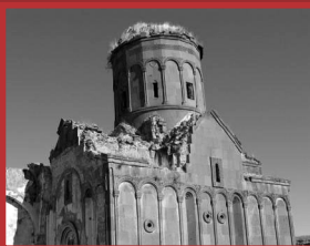
Լուսանկարում՝ ԱՄԻ-ի սբ. Գրիգոր Լուսավորիչ եկեղեցու ավերակները

Հայ-թուրքական հակամարտությունը խորն արմատներ ունի: Ոչ վաղ անցյալի չսպիացած վերքերն ու մերժողականությունը թունավորում են հարևան ժողովուրդների միջև հարաբերությունները: Հեղինակը մեծ ավանդ է ունեցել մեր օրերում երկու կողմերի միջև շփումների ակտիվացման և համատեղ ջանքերով ազգամիջյան թշնամությունը հաղթահարելու ուղիների փնտրման գործում: Դժվարագույն քննարկումների և զարգացումների մասին նրա կենդանի և վառ նկարագրությունը կլանում է ընթերցողին: Գիրքն ապացույց է, որ ժողովրդական դիվանագիտության համեմատաբար նոր գործընթացը հաշտեցան արդյունավետ միջոց է անգամ ամենառիսկոս հակառակորդների համար, և երկխոսություն ծավալելու, շփումների և համագործակցության միջոցով ուղի է հարթում մերձեցման համար: